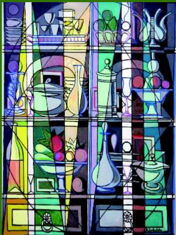
“Chinero” (1958) Rafael Zabaleta – Museo Zabaleta – Quesada (Jaén)

(Comarca de la Sierra Sur de Jaén 6, 7 y 8 de marzo de 2009)